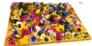
連携施設の花壇に咲いているお花で 押し花を作りました。 まだ出来上がっていません。 完成は5月です。 楽しみに待っているところです♪