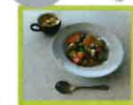
調理の会は 中華丼を作りました。